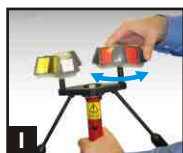
1 Tirer et tourner.