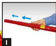
1 2 brins ou 4 brins.