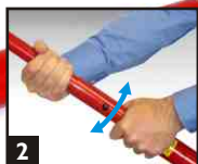
2 Déployer et tourner pour verrouiller.