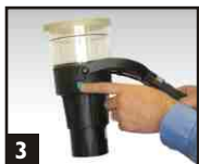
3 Appuyer sur le Commutateur. Placer sur le détecteur.

4 Si le détecteur ne s'active pas, cela peut signifier qu'il est défectueux. Remplacer le détecteur et renouveler le test.