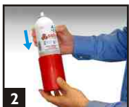
2 Placer l'aérosol dans le bol.