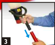
3 Insérer l'outil dans la perche.