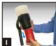
1 Dévisser et enlever le bol.