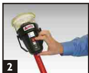
2 Appuyer sur le commutateur rouge pour activer. Le voyant vert s'allume. Un voyant qui clignote à intervalles lents indique un mode en VEILLE normal.

⚠ Attention Insérez la batterie dans l'outil selon le sens adéquat sans forcer de façon excessive.