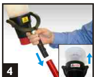
4 Insérer le Solo 330 dans la perche. Placer le Solo 330 sur le détecteur, en formant une étanchéité tout autour du bol.

5 Exercer une légère pression vers le haut pour activer l'aérosol. Si le détecteur ne se déclenche pas, renouveler l'étape ci dessus par jets d'une seconde. Ne pas effectuer plus de 5 jets. Si le détecteur ne s'est pas activé, vérifier votre équipement puis renouveler l'opération. Si le détecteur ne s'active toujours pas, une recherche plus approfondie sera nécessaire.