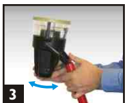
3 Mettre le système de verrouillage et placer sur le détecteur.

Conseil: Assurez-vous que le détecteur repose bien sur la plate-forme.