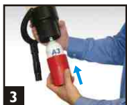
3 Remettre en place le bol et revisser vers le haut. Ajuster le bol jusqu'à ce que l'aérosol soit activé et dévisser légèrement.