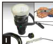
1 Relier le câble d'alimentation, fixer la pince et, au besoin, ajouter le câble d'extension en option.