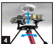
4 Saisir le détecteur. Tourner et tirer.