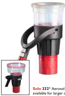
Solo 332 ® Aerosol dispenser available for larger detectors.