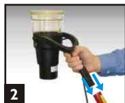
2 Insérer solo 423/4 dans La perche.