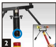
2 En cas d'insertion dans une perche Solo, localisez le bouton du bas afin d'accéder à des détecteurs positionnés dans des angles.