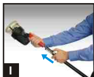
1 Insérer une batterie dans l'outil et la perche.

⚠ Attention Insérez la batterie dans l'outil selon le sens adéquat sans forcer de façon excessive.