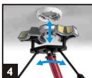
4 Saisir le détecteur. Tourner et tirer.