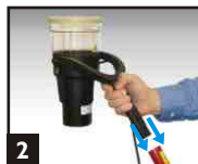
2 Insérer solo 423/4 dans La perche.