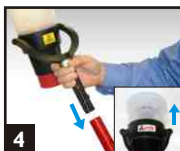
4 Insérer le Solo 330 dans la perche. Placer le Solo 330 sur le détecteur, en formant une étanchéité tout autour du bol.

5 Exercer une légère pression vers le haut pour activer l'aérosol. Si le détecteur ne se déclenche pas, renouveler l'étape ci dessus par jets d'une seconde. Ne pas effectuer plus de 5 jets. Si le détecteur ne s'est pas activé, vérifier votre équipement puis renouveler l'opération. Si le détecteur ne s'active toujours pas, une recherche plus approfondie sera nécessaire.