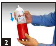
2 Placer l'aérosol dans le bol.